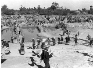
Photo 4 : Chantier hydraulique. 1975-1979.