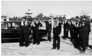
Photo 3 : Les principaux dirigeants khmers rouges. De gauche à droite : Pol Pop, Nuon Chea, Ieng Sary et Son Sen. Phnom Penh. 1975-1979.