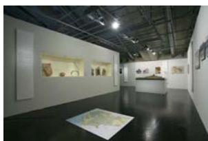
Photo 8 Vue de l'exposition