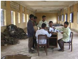
Photo 5 : S-21 La machine de mort khmère rouge. Rithy Panh. France – Cambodge, 2003. 1h40'.