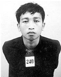
Photo 7 Détenu de Tuol Sleng. 1975-1979.