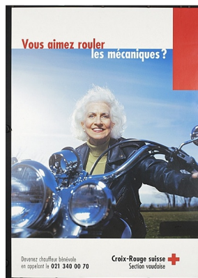
Vous aimez rouler des mécaniques ? Suisse. 2004.