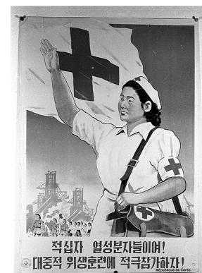
Membres dévoués de la Croix-Rouge, participons Activement aux Entraînements publics pour l'hygiène! Corée du Nord. 1956-1957.