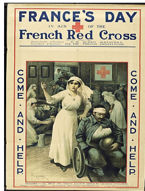
Journée française d'aide à la Croix-Rouge française. Forestier. Royaume-Uni. 1917.