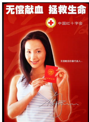
Donnez du sang et sauvez des vies. Chine. 2005. Collection MICR, don de la Croix-Rouge chinoise.