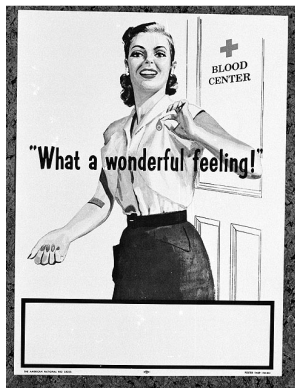
Quel sentiment formidable Etats-Unis. 1956.