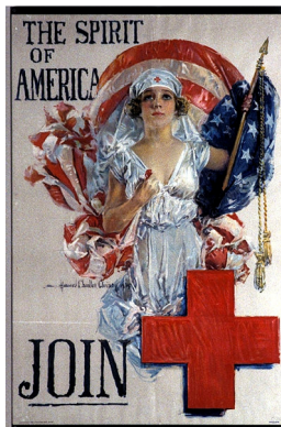
L'esprit de l'Amérique : viens. Howard Chandler Christy. Etats-Unis. 1919.