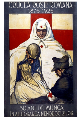
Croix-Rouge roumaine. Roumanie. 1926.