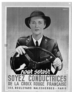
Pour servir, soyez conductrices de la Croix-Rouge française. France. 1940-1950.