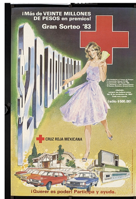
Grande loterie 83. Mexique. 1983.